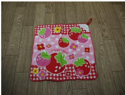
ループ付きタオル