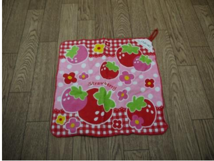
ループ付きタオル